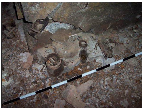
▲ [5018773] Das Podest mit Rohrmündungen für Fernsprechkabel.