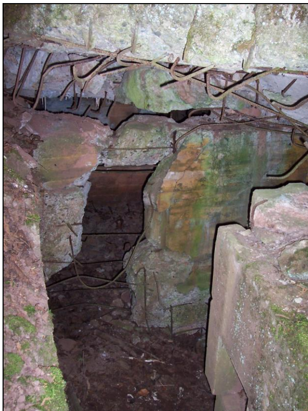
▲ [5018766] Blick durch den Eingang in die Gasschleuse.

Objektnummer 14013 Bauformnummer 17 Heutiger Zustand Ruine, teilw. mit aufliegender Decke. Stellungskarte/TK25 6811 Pirmasens-Süd