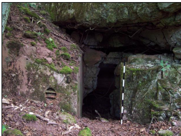
▲ [5018763] Ansicht von Nordosten: Der Eingang.

Autoren Aufmaß & Zeichnung © Patrice Wijnands