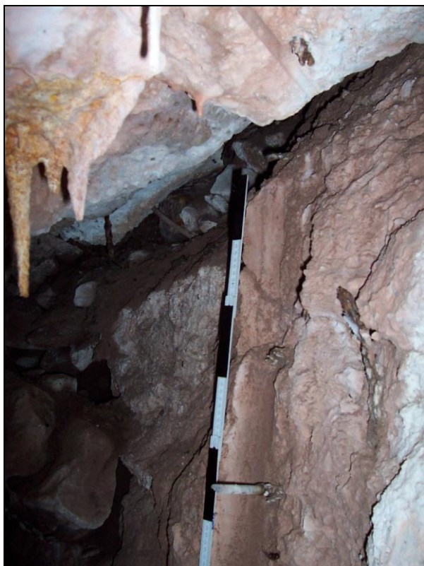
▲ [5018770] Der Abdruck von zwe 3 cm starken Platten an der Frontseite.