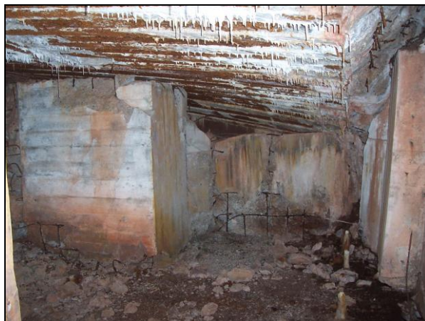
▲ [5018768] Links der Bereitschaftsraum, rechts der Kampfraum. Die Decke ist in die Scharte eingebrochen.