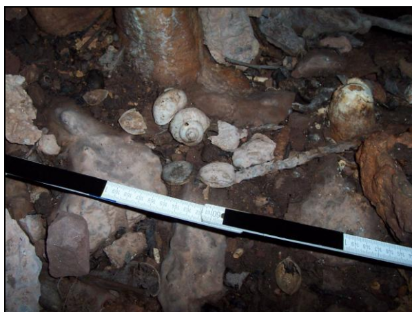
▲ [5018772] Nußschalen und Schneckenhäuser, möglicherweise Nahrungsreste.